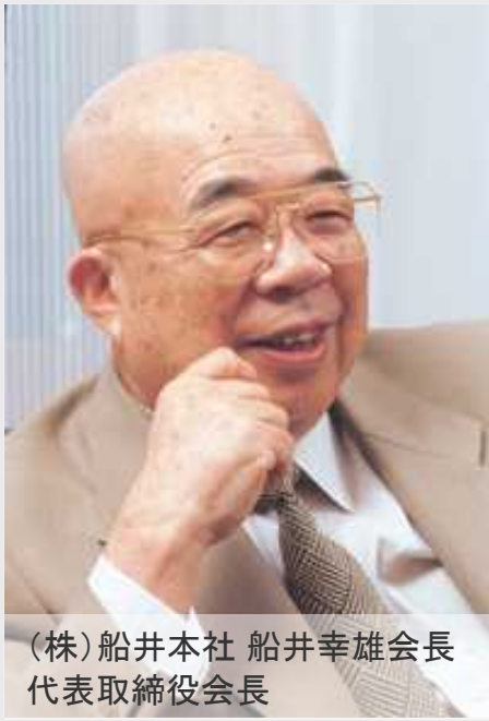
(株)船井本社 船井幸雄会長 代表取締役会長